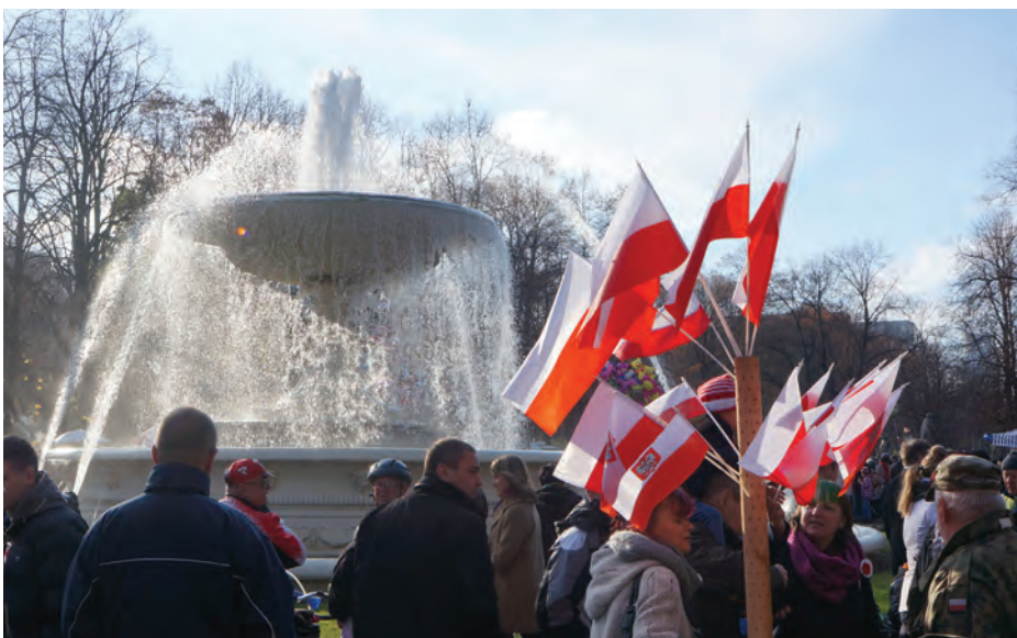
W Parku Saskim panował świąteczny - piknikowy nastrój.

Ludzie tłumnie wylegli na ulice, a w centrum Warszawy, na Krakowskim Przedmieściu i na Starym Mieście panował wesoły i świąteczny nastrój. Sprzyjała temu dobra pogoda i pięknie udekorowane ulice. Niemal na każdym rogu ulicy stali sprzedawcy polskich flag, chorągiewek i białych czerwonych kotylionów. Widok