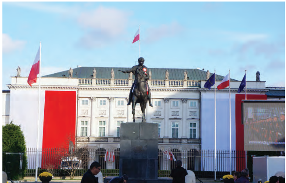
Uroczyste udekorowany Pałac Prezydencki w Dniu Święta Niepodległości.

Na zakończenie marszu, na ostatnim jego przystanku pod pomnikiem Józefa