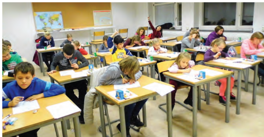
Dzieci wykazały się poważnym podejściem do konkursu ortograficznego.