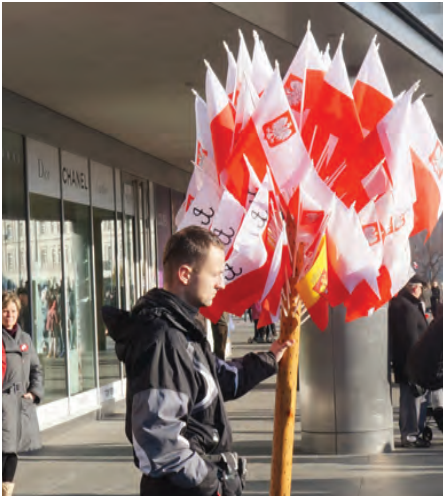
Sprzedaż flag i biało czerwonych kotylionów w wielu miejscach Warszawy.

dzieci i młodzieży z chorągiewkami napawał optymizmem i nadzieją, że to przyszłe pokolenie będzie dumne ze swojej polskiej tożsamości.