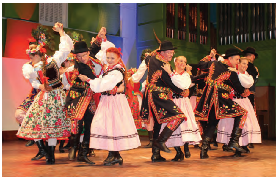
Piastowie, jak malowani, w strojach góralskich i nowosądeckich.