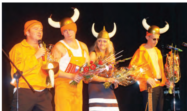
Artyści zostali obdarowani rogami Wikingów, ciekawe czy ten rekwiizyt znajdzie się w ich kolejnym repertuarze?

"Kabaret pod Wyrwigroszem" z Krakowa okazał się strzałem w dziesiątkę tego roku wśród innych koncertów jakie zapewnia nam działalność organizacji POLKA ikf. Po wielkim sukcesie parodii piosenki "Jożin z bażin" pod polskim tytułem "Donald marzy" kabaret stał się jednym