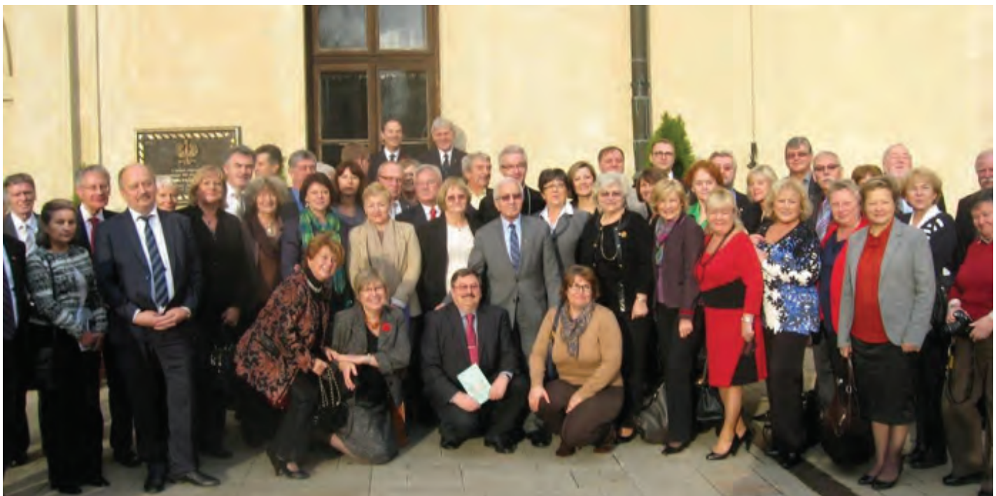
Przeszło 60 delegatów z całego świata obradowało podczas Zjazdu Rady Polonii Świata.