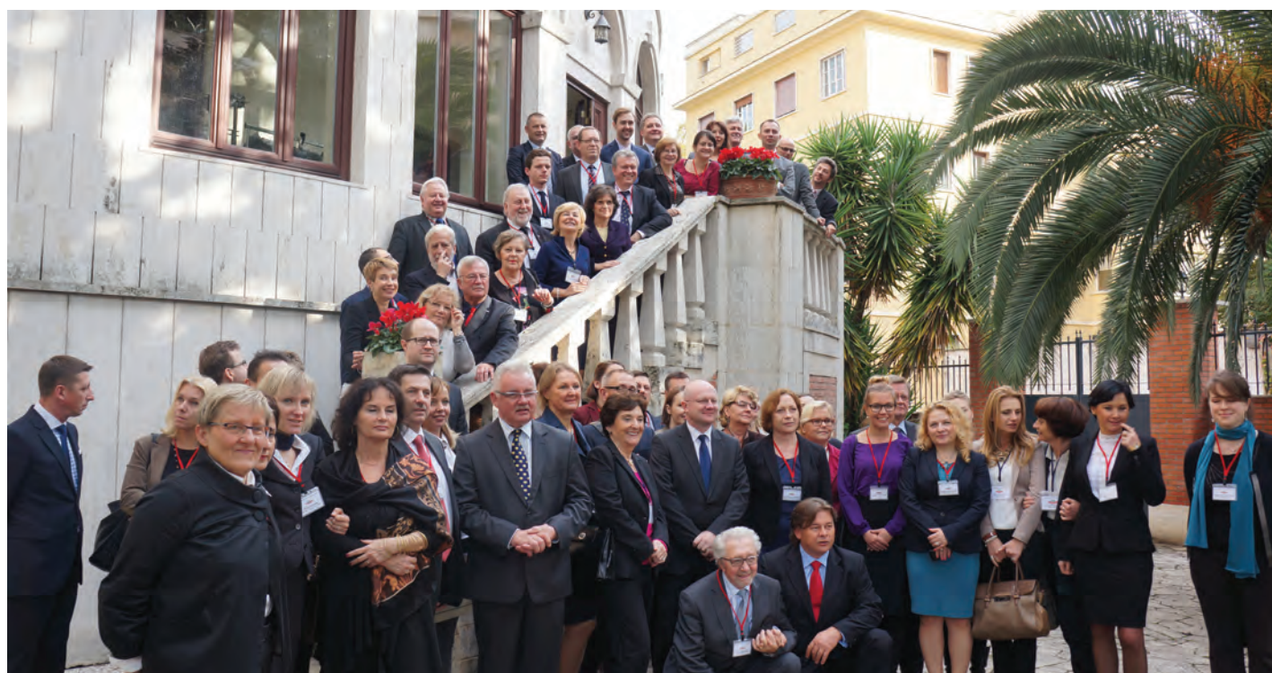
Uczestnicy Konferencji Monitor 2013 "Emigracja w dobie kryzysu" przed budynkiem Ambasady RP w Rzymie.