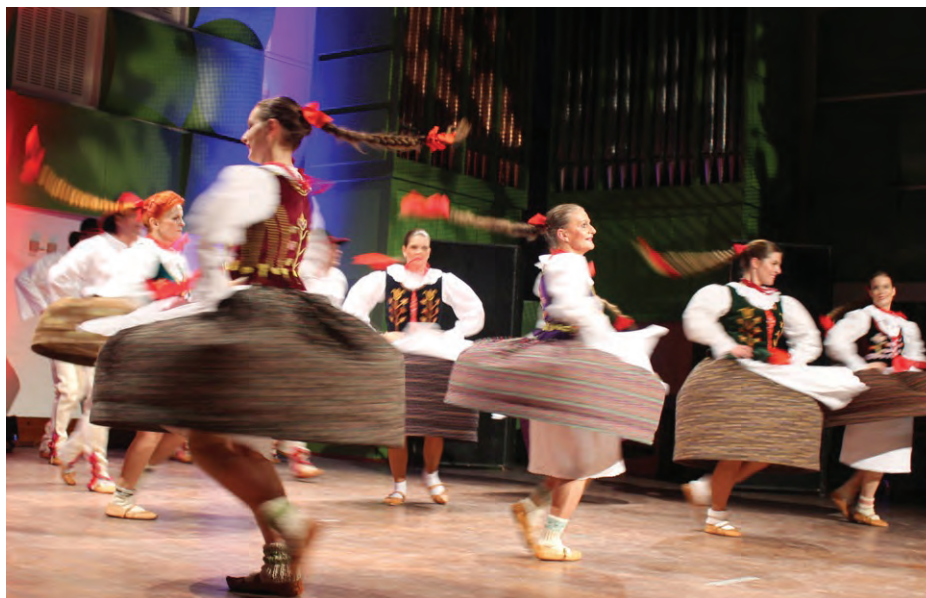
Piaśtowie w tańcu góralskim, jednym z wielu tańców w ich repertuarze.

Dla wszystkich członków zespołu, przynależność do „Piaśtów” to nie tylko występy, ale także poszerzanie wiedzy o Polsce i jej kulturze.