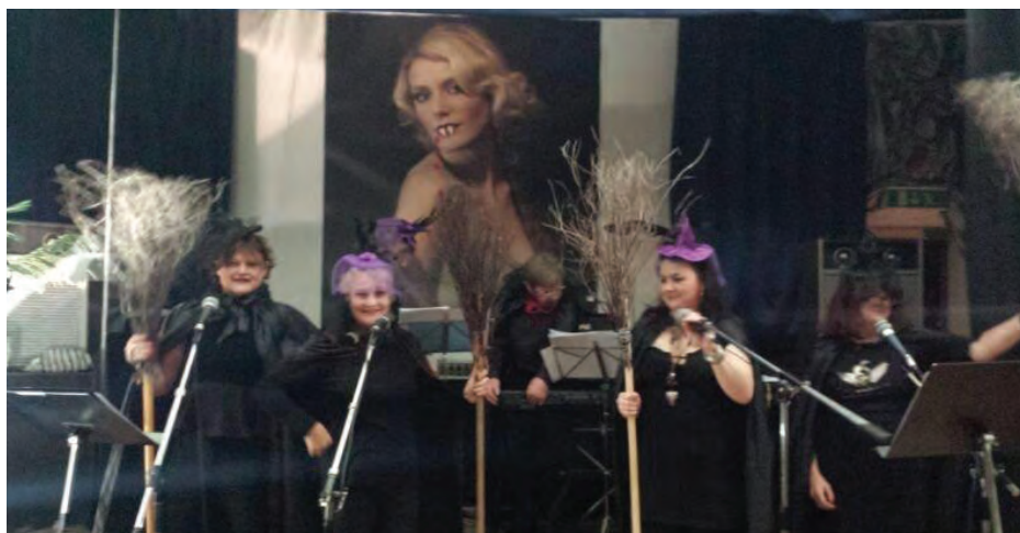
Wspaniały "Kabaret Beznadziejny" w nowym repertuarze Halloween.

Proszę zwrócić uwagę, że brak ostrości na zdjęciu nie jest spowodowany złym aparatem fotograficznym czy nieumiejętnością fotografa. Jest to wynik "sztucznego zadymienia". W lokalu paliły się świece a specjalna maszyna