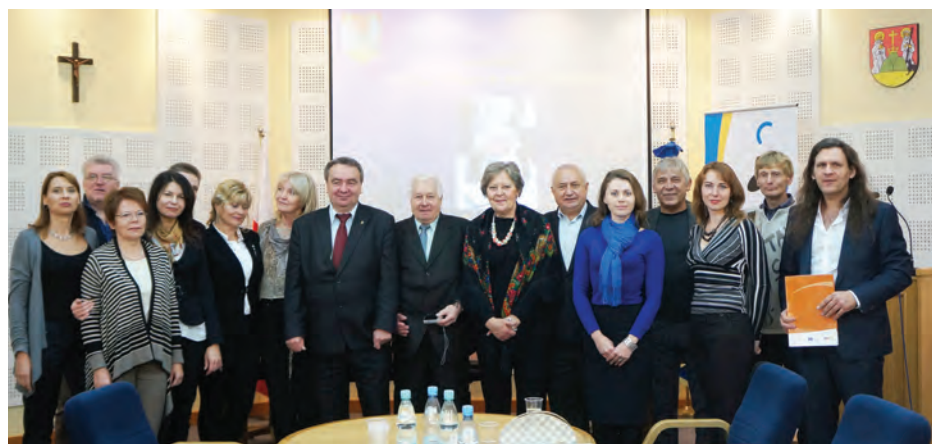
Uczestnicy pierwszego spotkania z wizytą w Urzędzie Miasta Suwałk.

Podczas pierwszego spotkania uczestnicy mieli możliwość zapoznania się z działalnością na rzecz romskich dzieci. W Suwałkach działa jedyna w Polsce szkoła polsko-romska na prawach szkoły publicznej przy parafii rzymsko-katolickiej pw. Najśw. Marii Panny. W tych samych klasach uczą się dzieci polskie i romskie, a pomoc dla nauczycieli w czasie lekcji stanowią asystentki romskie. Przerwy między lekcjami wyglądają nieco inaczej niż w innych szkołach. Szkoła ma „służbową” gitarę, z której korzystają młodzi muzycy romscy i którzy podczas długiej przerwy grają i śpiewają ku uciechu pozostałych dzieci.