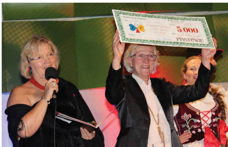
Zrzeszenie Organizacji Polonijnych w Szwecji, federacyjna organizacja dla Zespołu Folklorystycznego „Piastowie” uhonorowała ich Jubileusz życzeniami i czekiem.

I ja tam byłam, miód i wino piłam oraz chleb ze smalcem i pierogi jadłam i do rana się bawiłam, a teraz czekam na następny jubileusz 50-lecia Zespołu.