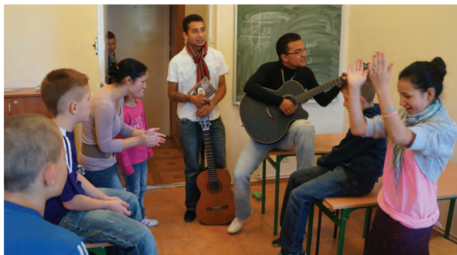
Uczniowie a zarazem członkowie zespołu muzycznego Bachtale Roma mają stałe zajęcia na długiej przerwie: grają i śpiewają ku uciechu pozostałych uczniów.