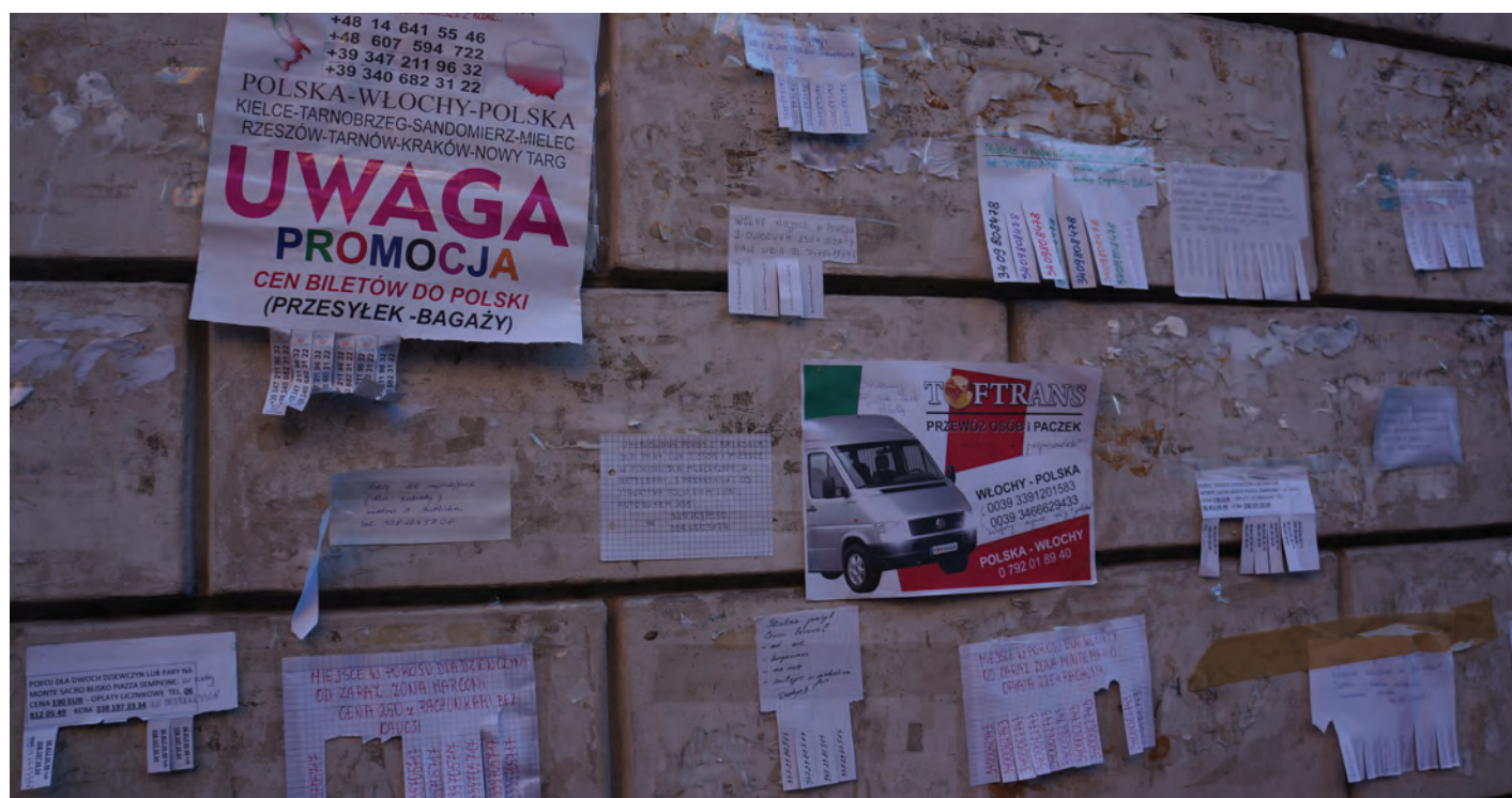
Polskie ogłoszenia na ulicy Rzymu w pobliżu polskiego kościoła.